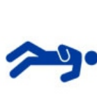
LOSS OF CONSCIOUSNESS